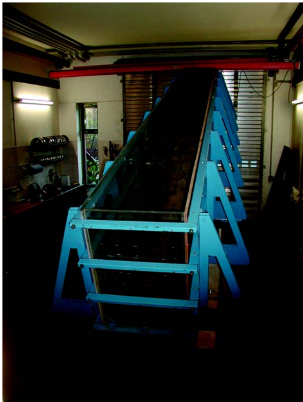
Bild 4: Kipprinne, die bei der CDM Jessberger GmbH zur Verfügung steht

Zur Ermittlung der Dränkapazität werden Kipprinnen eingesetzt, in denen die Verhältnisse im Maßstab 1 : 1 untersucht werden können. Die Kosten für einen solchen Kipprinnenversuch entsprechen etwa denen einer Eignungsprüfung für bindiges mineralisches Dichtungsmaterial. Bild 4 zeigt beispielhaft eine solche Kipprinne.